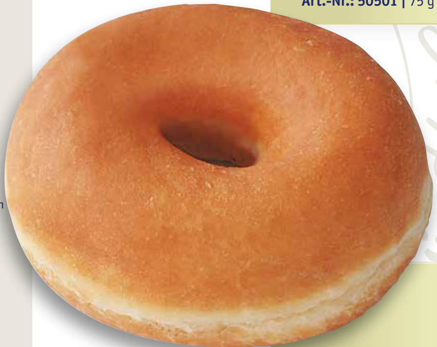
Hefe Donut XL Natur