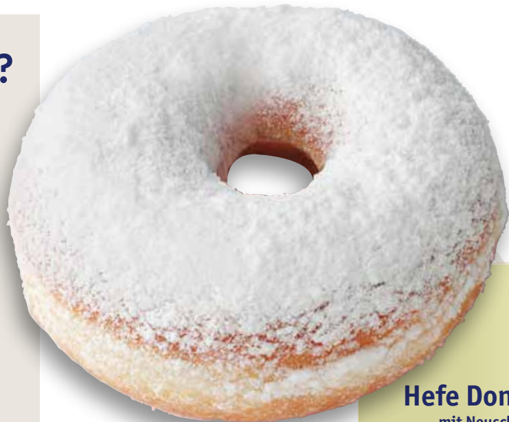
Hefe Donut XL mit Neuschnee

Einfach QR-Code scannen und Sie gelangen direkt zu weiteren Informationen über unser Produktportfolio auf www.bake-line.com