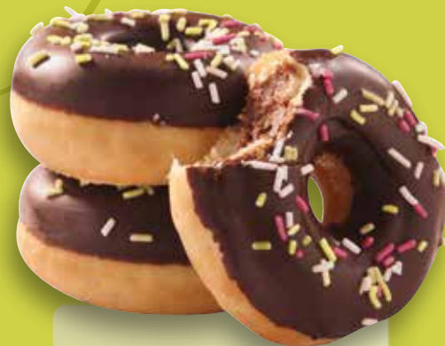
Mini Donut Chocolate filled Fourrage cacao-noisette, glaçage cacao, vermicelles multicolores Art. n°: 56405 | 24 g env. 135 pièces/carton