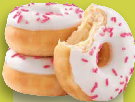
Mini Donut Vanilla filled Fourrage saveur vanille, glaçage blanc, vermicelles roses Art. n°: 56406 | 24 g env. 135 pièces/carton