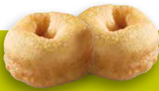
Mini-Donut Nature env. 12 g