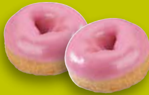
Mini-Donut Glaçage rose env. 12 g