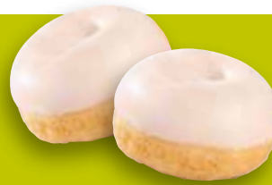
Mini-Donut Glaçage blanc env. 12 g