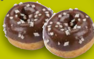
Mini-Donut Glaçage cacao, pépites de chocolat blanc env. 12 g

disponibles en assortiments individuels!