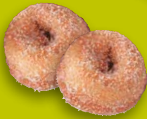
Mini-Donut Sucre-cannelle env. 12 g