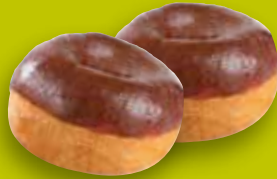
Mini-Donut Glaçage cacao env. 12 g